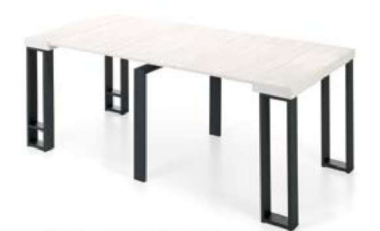
MESA + 3 EXTENSIBLES [ 195 cm ]