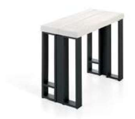
MESA CERRADA [ 45 cm ]