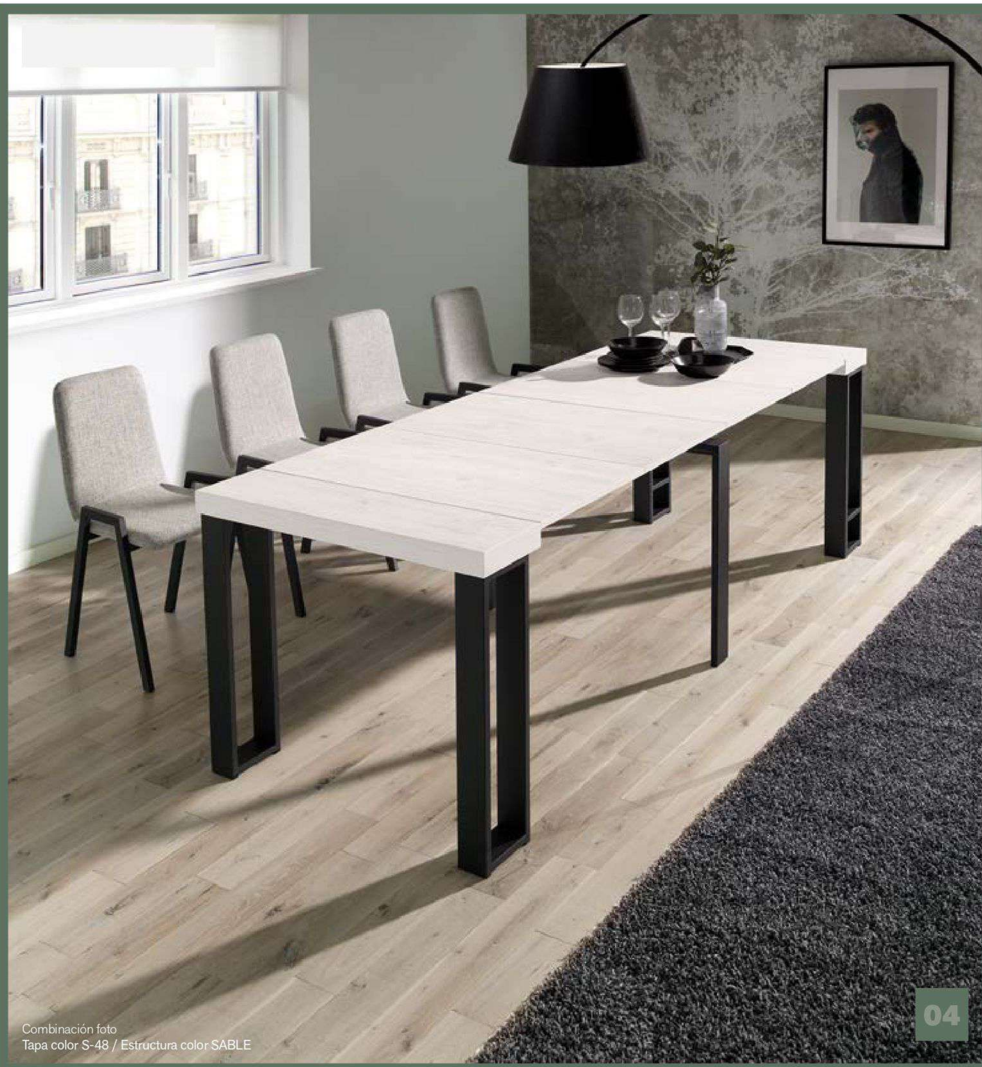
Combinación foto Tapa color S-48 / Estructura color SABLE