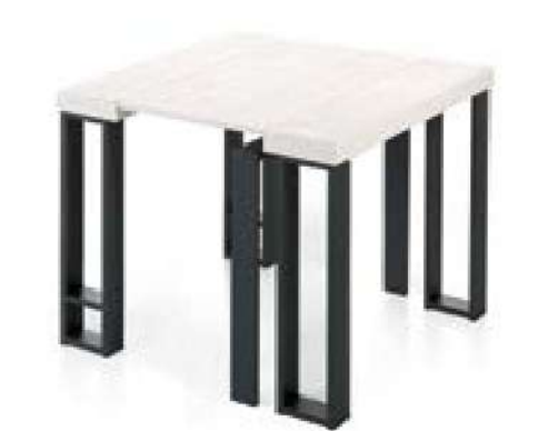
MESA + 1 EXTENSIBLE [ 95 cm ]