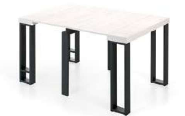
MESA + 2 EXTENSIBLES [ 145 cm ]