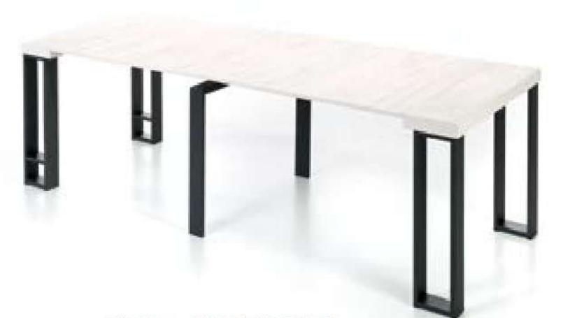
MESA + 4 EXTENSIBLES [ 245 cm ]